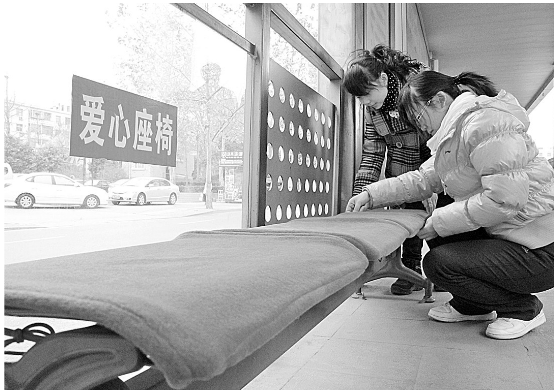
昨日下午,快速公交桐柏路中原路车站台上,工作人员在“爱心座椅”上安装保暖坐垫。站务长说:“天气大幅降温,金属座椅表面冰凉,安上棉坐垫,乘客坐着舒服,我们心里也高兴。”