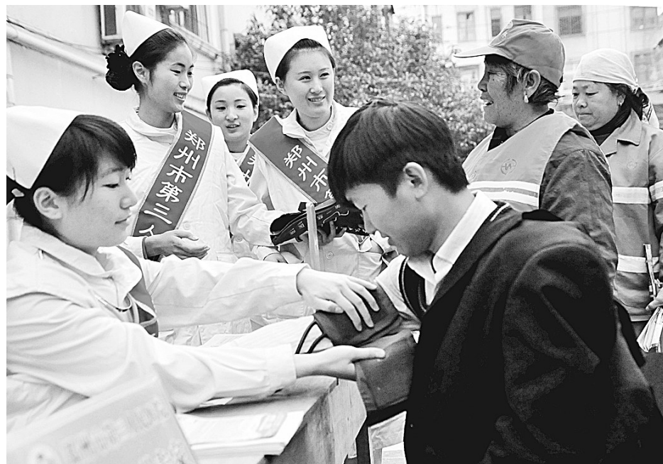
西大街办事处南学街社区昨日迎来市第三人民医院党员志愿者义诊服务队。市三院近日组织党员医务工作者走进社区,开展送温暖义诊活动。

台,包括撒布机1台、除雪车6台、运输车9台、装载机4台、平地机4台,人工除雪工具基本做到环卫工人人手一把。 市城市管理局要求各区分必加强对清除冰雪工作的领导,尽快保证所有除雪物资到位,并加强培训,进一步提高清除冰雪效果,最大限度地预防和减少降雪等灾害性天气给市民工作和生活带来的不便。