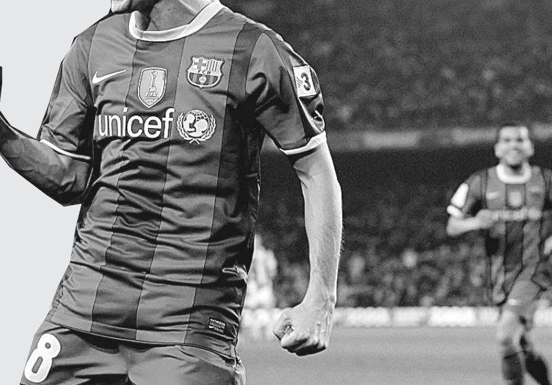
巴塞罗那队球员伊涅斯塔庆祝进球。

下半场伊始,巴萨又由梅西在与阿尔维斯连续配合后破门,确立了3:0的优势。第86分钟,梅西与博扬配合,阿根廷人禁区内晃过几名防守球员,门前推射得分。终场前,博扬再入一球,将比分锁定为5:0。巴萨凭借这场胜利继续领跑西甲联赛积分榜。