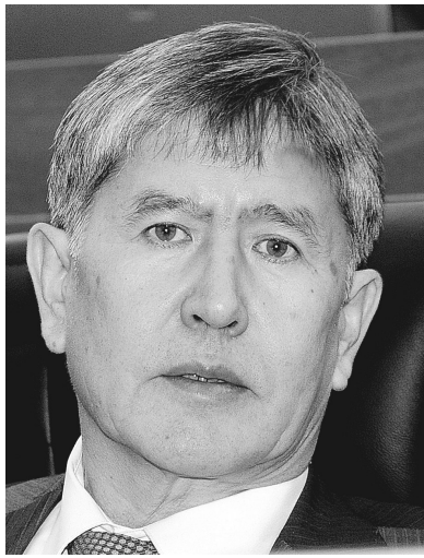
12月17日,吉尔吉斯斯坦社会民主党领袖阿坦巴耶夫在比什凯克出席议会会议。

阿坦巴耶夫出任总理由16日宣布成立的“共和国”党、“故乡”党和社会民主党3个党派执政联盟提名。