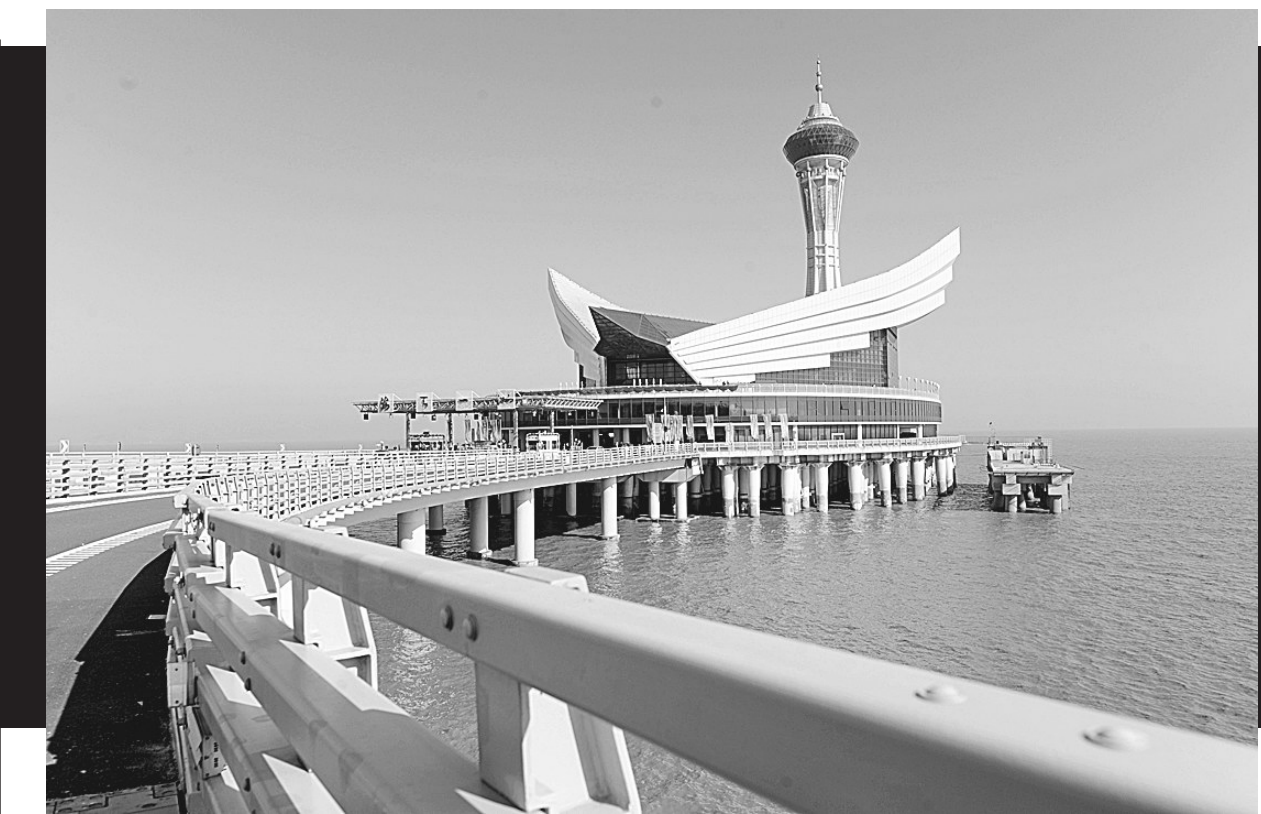
正式落成的“海天一洲”观光塔和观光平台。当日,经过3年建设的杭州湾跨海大桥海上观景平台“海天一洲”正式落成。“海天一洲”距离杭州湾跨海大桥南岸1.7公里,由观光台和观光塔组成,海面上面积12000平方米,其中观光塔高146.5米,共16层。整个观光平台集观光旅游、餐饮购物、住宿于一体。观景平台各类设施已基本装修完毕,将于12月19日开始正式对外开放。