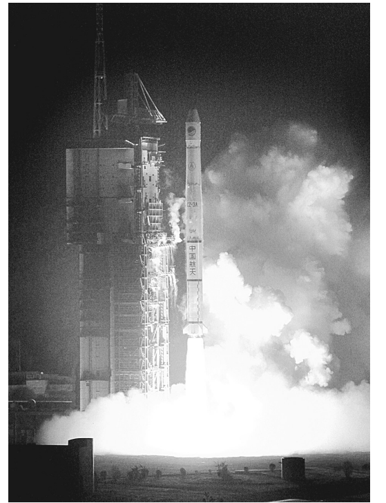
据新华社西昌12月18日电 18日4时20分,我国在西昌卫星发射中心使用长征三号甲运载火箭,成功将第7颗北斗导航卫星送入太空预定转移轨道(上图)。

至此,今年我国共进行了15次航天发射,全部获得成功。第7颗北斗导航卫星是一颗倾斜地球同步轨道卫星,也是我国今年连续发射的第5颗北斗导航系统组网卫星。