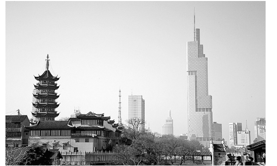
12月18日拍摄的南京紫峰大厦。当日,江苏第一高楼南京紫峰大厦落成开业。紫峰大厦高达450米,总层数89层,是目前江苏最高的建筑,其高度在全世界已建成和在建的摩天大楼中位居第七。