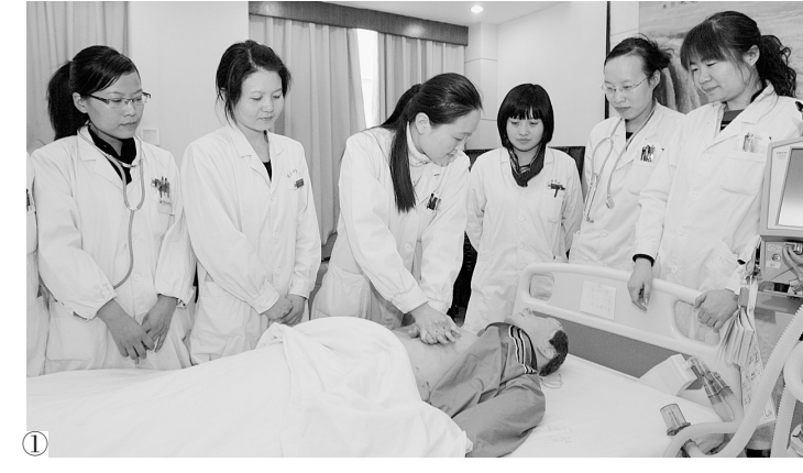
①省胸科医院日前进行多期急救操作技术培训,培训采取理论讲座和现场操作相结合的方式,主要对呼吸机操作等急救技术进行培训。