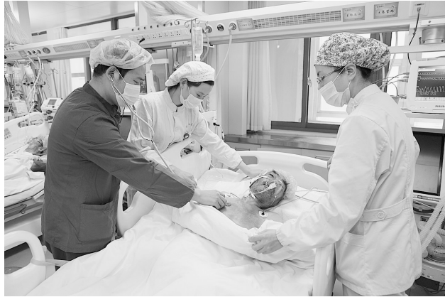
本报讯(记者梁晓 通讯员王建明 李梦雨 靳巍巍)文/图)12月17日晚,市中心医院急诊科接到120急救中心的指派,前往中原路西三环南200米处救援一位遭遇车祸的老人...