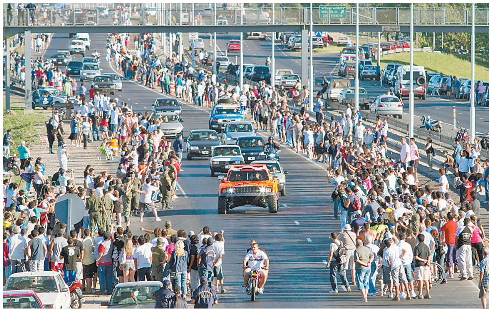
1月2日,阿根廷民众等候在科尔多瓦市的公路两侧,迎接参加达喀尔拉力赛的车手抵达。达喀尔拉力赛当天举行了首日的正式比赛。