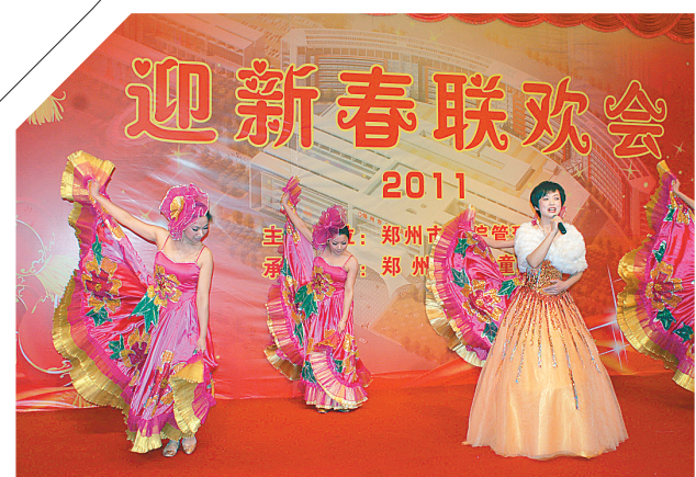
昨日,郑州市医院管理协会和郑州市儿童医院联合举办了迎新春联欢晚会,白衣天使们载歌载舞,表演自编自排的精彩节目,庆贺新春。