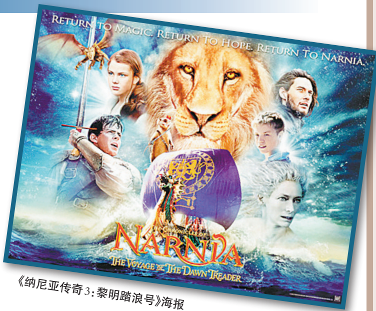
《纳尼亚传奇3:黎明踏浪号》海报

不可否认,《纳尼亚3》像前两集一样,仍向观众展示了那个带有魔幻色彩的国度,那里有会说话的老鼠、直立行走的牛头人,还有被施了魔法隐形的独脚怪等,这种想象力和神奇感令人耳目一新。此外,影片3D特效呈现的奇幻海景、灿烂星空、皑皑雪地等景观也着实令人小小地惊艳了一把,然而无论是大决战等重头戏,还是飞龙在空中俯冲、海怪血盆大口袭来等场面却被处理得相当潦草简单,立体感不强,无法带给人们震撼。