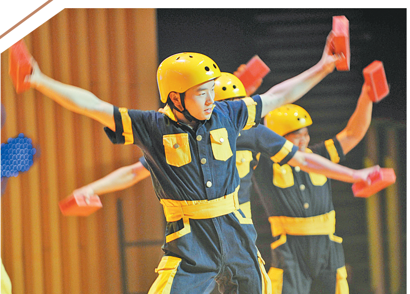
1月10日,来自深圳的农民工在表演舞蹈《快乐的建筑工》。当日,“我们的节日”——群星奖优秀节目2011年春节慰问外来务工人员文艺晚会在北京五棵松体育馆举行。来自中铁集团、城建集团等单位的近3000名外来务工人员及农民工子弟学校的学生观看了演出,欢度自己的节日,整台晚会呈现出了“农民工演、演农民工、农民工看”的特点。

据艺术中心工作人员介绍,作为一项文化惠民措施,首届“市民音乐会”是河南艺术中心继“打开艺术之门”、“走进艺术殿堂”、“请把我的歌带回你的家”公益系列演出之后,为丰富艺术舞台、普及高雅艺术所推出的又一品牌项目,将以30-100元的低票价让更多普通老百姓走进音乐殿堂,共同欣赏高品质的中外音乐经典作品。