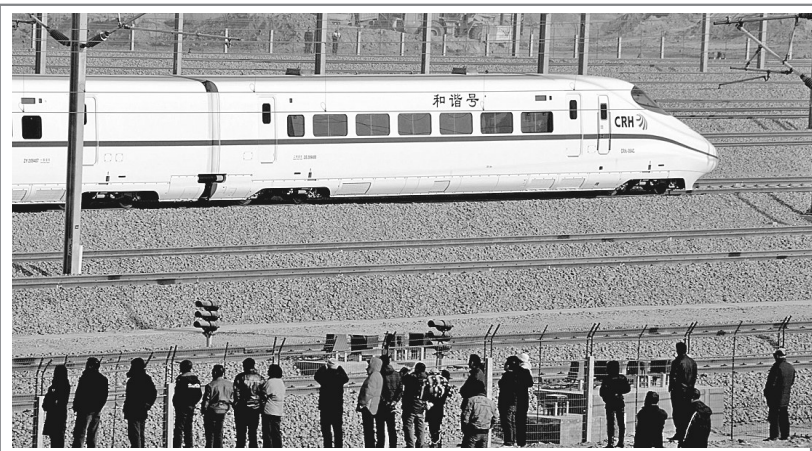
1月11日,我国西北地区最大的火车客运站——西安北站正式投入使用。主要承担高铁运输任务的西安北站投入使用后,已经开通的郑州至西安客运专线的14对高铁列车于11日首先接入,今后将逐步引入西安至成都、银川、大同等城市的高铁列车,此外关中城际铁路列车也将引入西安北站。图为居民在西安北站外观看一列动车组出发。