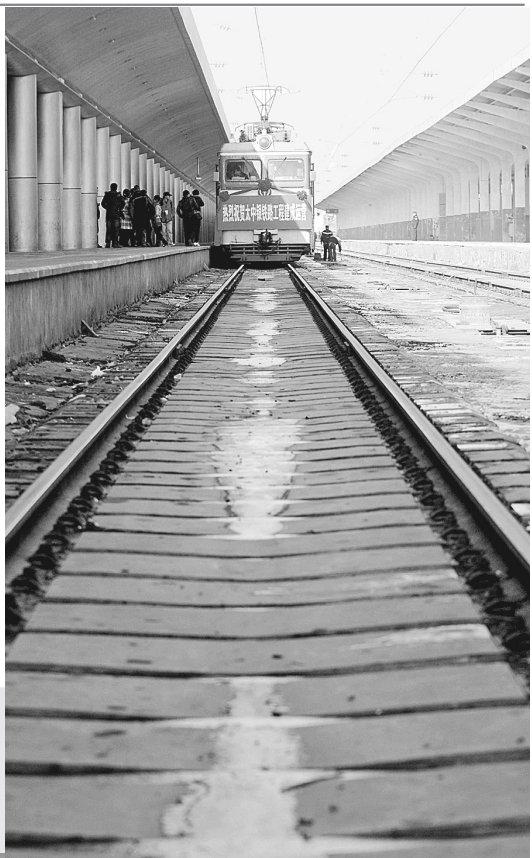
1月11日,全长944公里的太原(中)银(川)铁路正式宣告全线通车。太中银铁路东起山西太原,横贯山西、陕西、宁夏三省区,西端分别至宁夏中卫和银川。铁路全线通车后,我国西部地区至华北主要城市的运输距离分别缩短100公里至500公里。图为一辆货车即将沿着太中银铁路驶出银川站。