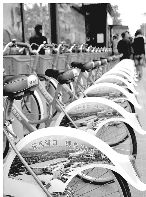
1月11日,海口4个公共自行车网点投入使用,市民凭一张智能卡可在任意网点租还自行车。据了解,海口计划建设1000个自行车租赁服务网点,投放约2万辆自行车,保障海口市市民低碳、绿色出行。图为海口市公共自行车服务网点停放的自行车。

同时,记者从市福彩中心获悉,2010年,是本市福利彩票销售创历史新高的一年,共销售福利彩票7.53亿元,比2009年的5.33亿元销量增长了2.2亿元,增幅达41.28%,创下了22年来福彩年销量之最,为发展社会福利事业筹集公益金做出了重大贡献。在全部7.53亿元的总销量中,电脑票销量为5.51亿元,网点开票销量为1.3亿元,中福在线票销量为7200万元。