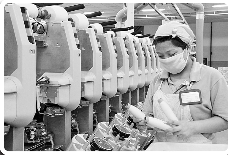
某纺织企业职工正紧张作业。