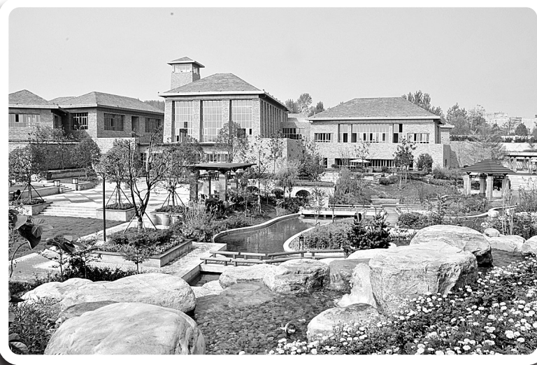
优雅的宜居环境让人流连忘返。