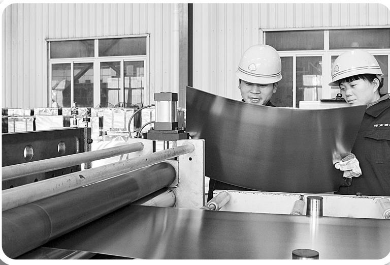
质检人员在抽检钢板质量。