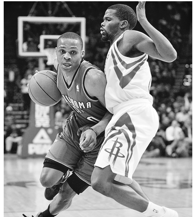
火箭队球员布鲁克斯(右)防守雷霆队球员维斯布鲁克。

是役火箭的斯科拉收获31分和11个篮板,杜兰特贡献30分,而韦斯特布鲁克有23分和13次助攻入账。目前火箭的战绩为17胜22负,被灰熊从西部排名榜第九位挤到第十。