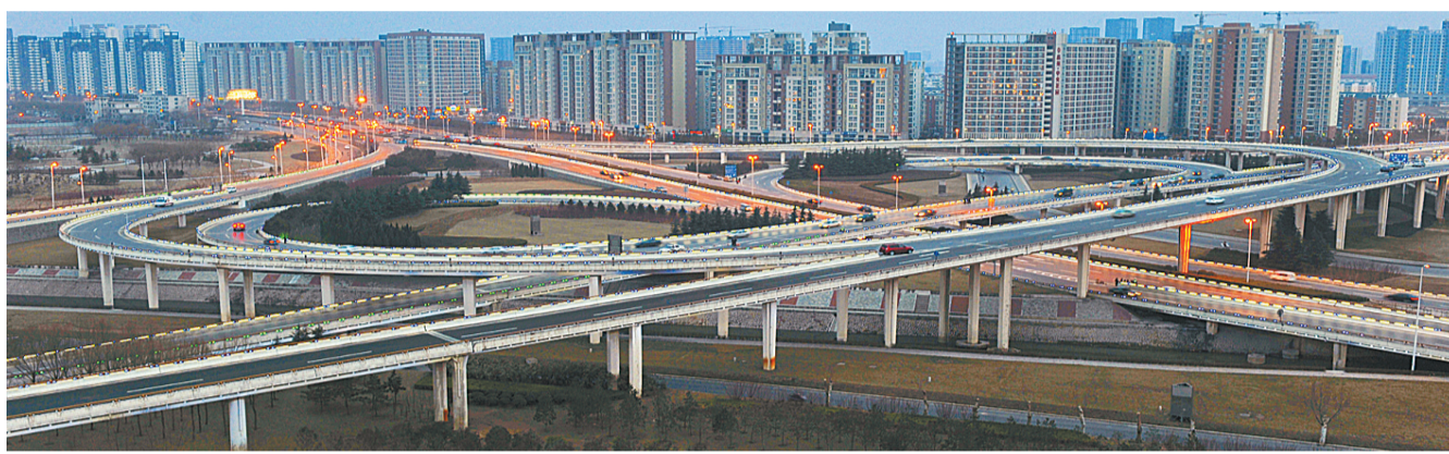
四通八达的城市道路为市民出行提供了便利。