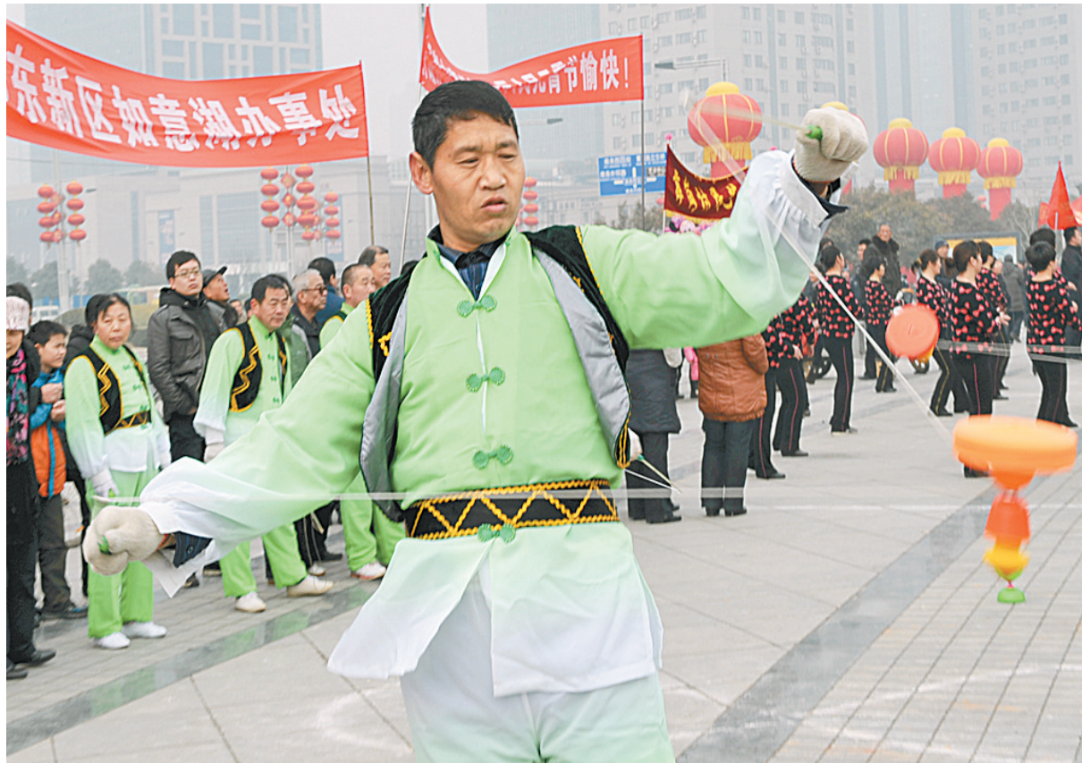
昨日,郑东新区举行的2011年民间文艺展演活动,让河南省艺术中心广场充满着喜庆的节日气氛。祭城、如意湖、商都路、龙子湖、博学路五个办事处共15支表演队参加了此次活动,活动内容包括盘鼓、秧歌、民间绝活等绝活表演。