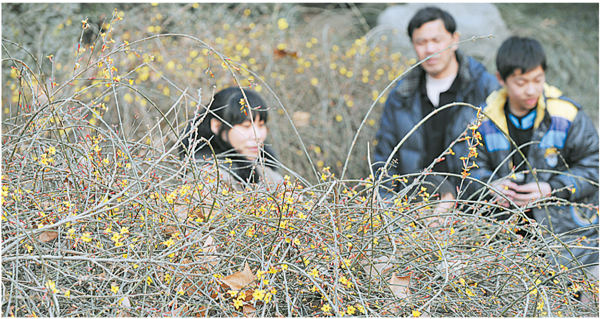
“金英翠萼带春寒,黄色花中有几般?”又是一年春来到,我市碧沙岗公园内的迎春花竞相开放,让游客提前感受到春天的气息。

气象专家指出,根据气象学上的划分,3月份才算是春季,由于近期冷空气活动频繁,乍寒乍暖,天气变化无常,提醒大家要注意“春捂”,及时添加衣服,以免感冒。