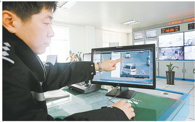
交警演示新升级成功的电子系统。