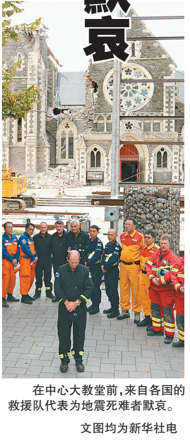
在中心大教堂前,来自各国的救援队代表为地震遇难者默哀。

据新华社电 英国伦敦一家法院2月28日裁定,前英国航空公司计算机专家拉杰·卡里姆企图炸毁飞机。 卡里姆现年31岁,2006年从孟加拉移居英国,曾与宗教极端人士安瓦尔·奥拉基密谋策划,试图帮助奥拉基对英航发动劫持或破坏性袭击。美国情报机构认定,奥拉基是“基地”组织阿拉伯半岛分支领导人之一。 卡里姆被控图谋炸毁一架飞机,向恐怖组织提供信息,协助对英航袭击和出于恐怖主义目的在英国获得工作等涉及恐怖主义罪名。 路透社援引控方反恐律师科林·吉布斯的话报道,卡里姆曾报名申请加入机组。“可以想象……如果他成功的话,后果有多可怕。”吉布斯说。