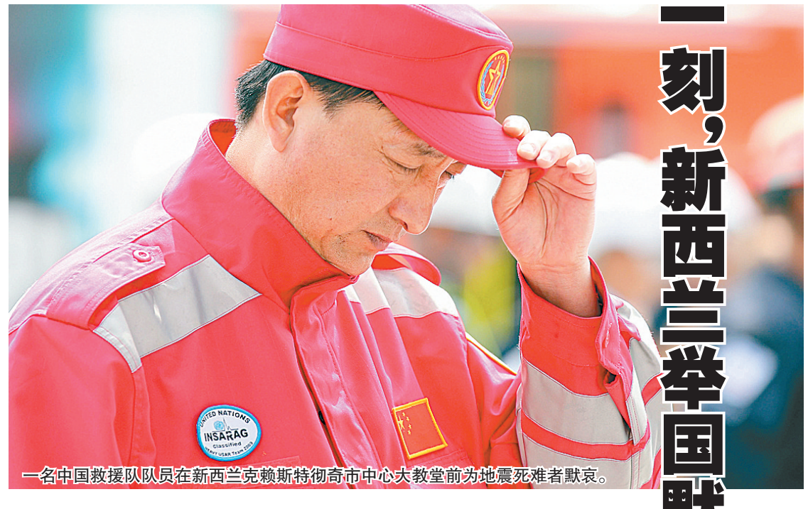
一名中国救援队队员在新西兰克赖斯特彻奇市中心大教堂前为地震遇难者默哀。

当地时间3月1日中午12时51分,距离克赖斯特彻奇地震发生整整一周,新西兰民众停下手中一切事务,静静合上双眼,为这次地震中的遇难者默哀两分钟。这一刻,新西兰全国各地教堂的钟声同时响起,传递着生者对逝者的思念。 尽管地震发生地——新西兰南岛最大城市克赖斯特彻奇当天艳阳高照,但却难以抹去人们心中的阴霾。新西兰总理约翰·基,在野党工党领袖戈夫·克赖斯特彻奇市长帕克等政界人士在市中心与工作人员一起默哀。 两分钟,寂静而漫长,在场的人们都闭上双眼,在心中为遇难者祈祷,不少人脸上露出痛苦的表情,像是忆起了七天前那地动山摇的悲情一刻。 “默哀让人百感交集,在地震后的一周里,很多人忙于清理和救援工作,没有时间细想经历的一切,但默哀的时候,所有的记忆都会浮现,让人感慨万千。”克赖斯特彻奇市市长帕克如是说。 同一时刻,来自不同国家和地区的人们都闭上双眼,在心中为遇难者祈祷,不少人脸上露出痛苦的表情,像是忆起了七天前那地动山摇的悲情一刻。 “默哀让人百感交集,在地震后的一周里,很多人忙于清理和救援工作,没有时间细想经历的一切,但默哀的时候,所有的记忆都会浮现,让人感慨万千。”克赖斯特彻奇市市长帕克如是说。 当地时间2月22日12时51分,克赖斯特彻奇发生里氏6.3级浅源地震。新西兰警方3月1日宣布,目前已确认154人在地震中遇难,50人失踪。预计遇难者总数可达240人。