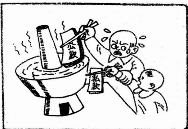
——小祖宗，这也吃得！ 宝吉 绘

第四次“决斗”发生在1796年。乐圣贝多芬到柏林去旅行演奏，有机会与柏林宫廷乐师亨特决斗。