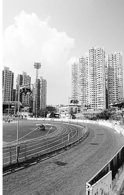
(本版均为资料图片)