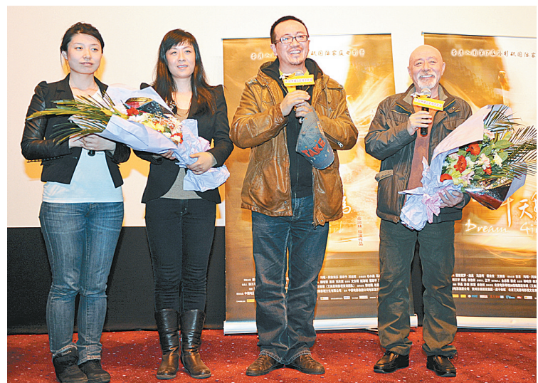
剧组主要演职人员亮相。

第二局,上海女排乘胜追击越战越勇,并以16:2领先进入第二次技术暂停,溃败的河南女排虽然发起了一定的反击,但还是以11:25再丢一局。第三局,河南女排终于有所起色取得5:1的开局领先,但技高一筹的主队很快将比分追平反超。本局末段,河南女排虽在进攻上有所建树,但依然无法阻挡上海女排取胜的气势,最终,上海女排以25:19拿下第三局,取得了整场比赛的胜利。