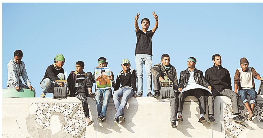
3月19日,利比亚领导人卡扎菲的支持者在他位于的黎波里的住所——阿齐齐亚兵营内参加“人肉盾牌”活动。

军方发言人约翰·洛里默说,20日夜间,英国空军“旋风”轰炸机前往利比亚执行第二次轰炸任务。“当GR4型‘旋风’式轰炸机接近目标时,有信息显示目标区域有相当数量的平民出现。结果是,取消轰炸。”洛里默称:“这一决定显示英国保护(利比亚)平民的决心。”