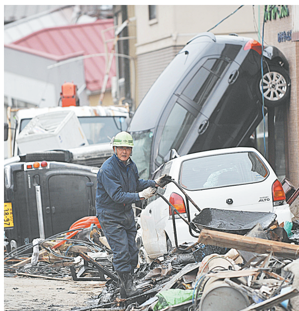
3月20日,在日本大地震重灾区气仙沼,一位老人在清理废墟。

在日本大地震及海啸之后,丧失亲朋和财产尽毁的痛苦尚未消退,重建自救工作已经开始,很多人正在废墟上重新搭建自己的家园。