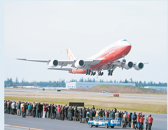
3月20日,一架波音747-8洲际客机在美国华盛顿州的佩因菲尔德机场起飞。

据新华社电 美国飞机制造巨头波音公司新近问世的波音747-8型洲际客机20日首次试飞。