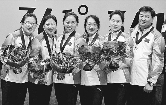
3月27日,中国队队员和教练在颁奖仪式上合影。当日,在丹麦举行的2011年女子冰壶世锦赛铜牌争夺赛中,中国队以10:9战胜丹麦队,获得季军。

朴志恩被认为是当今世界上最强的女棋手,而中国老将芮乃伟亦曾长期称雄世界棋坛,这场比赛堪称围棋“新老女子第一人的对决”。此前芮乃伟刚刚连胜韩国三名女将,士气正盛,不少棋迷看好她能赢到最后,但实战的进程却出人意料。