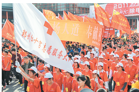
市红十字会志愿者参加比赛。