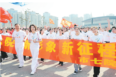
市七院医护人员参加小马拉松比赛。