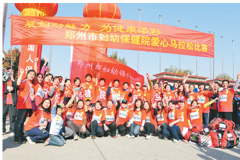
市妇幼保健院职工参赛风采。