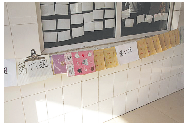
高二年级“错题集”展示活动现场

用半个小时完成作业,到用一个星期时间改掉一种不好的习惯,再到用几个月的时间学会一种技能……该校学生不仅学会了制定学习计划,也逐步开始学习规划自己的人生,真正成为了时间的主人。