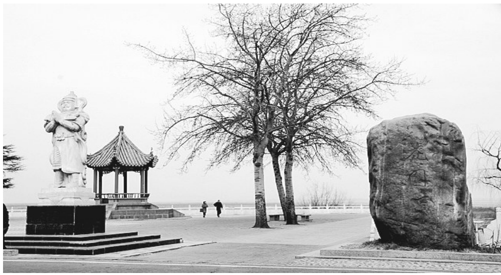
花园口段黄河大堤是观赏黄河的好去处 (资料图片)

其独特的自然景观,也可以作为自然遗产来申报,黄河大堤与下游黄河如果作为文化与自然双重遗产申报,是一件非常有意义的事。