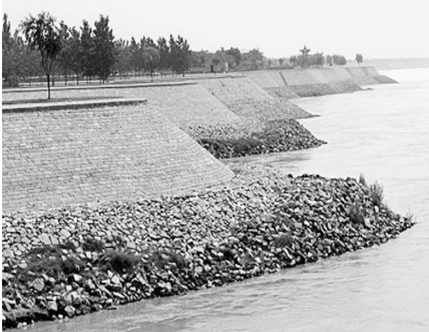
黄河大堤已成为“水上长城”

返璞归真,回归自然是旅游业的主流发展方向,网友“惟信”、“若一邻”等人认为,黄河大堤空气好、噪音少、绿化好、地形起伏适度,建议在黄河大堤沿山至花园口一线,适度开发健身休闲走廊,开发徒步、骑行等新型健身项目,使黄河大堤成为郑州市的一大休闲旅游景点。