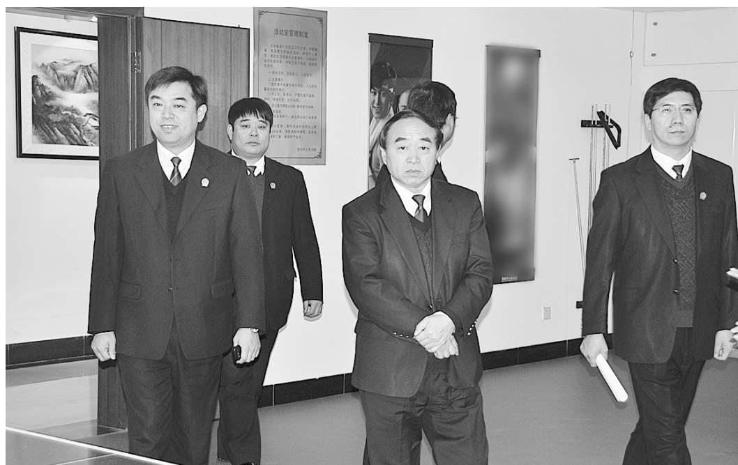
郑州市中级人民法院院长王新生(右二)参观荥阳市人民法院文化建设情况。

多措并举,打造廉政型法院。坚持廉政教育经常化,做到逢会必讲,警钟长鸣。专门组织廉政知识考试,进行廉政谈话,筑牢法官队伍拒腐防变的思想防线。建立“廉政监督卡”随案发放当事人制度,接受当事人的全程监督;完善廉政监察员制度,在审判、执行部门设立13名廉政监察员,加强对法官的日常教育和经常性监督。