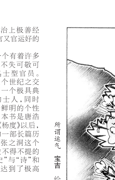
所谓运气 宝吉 绘

保持心中的 纵然小溪有几多清澈 也难比海的辽阔 叶脉在叶子上蜿蜒 根在地下伸展 阳光知道花和叶的颜色 地下的扩张多么荒诞 落叶匆匆遮盖容华 我的墓穴却未掩埋记忆 抓住时间白色的裙角 只想留住奔涌而去的浪涛