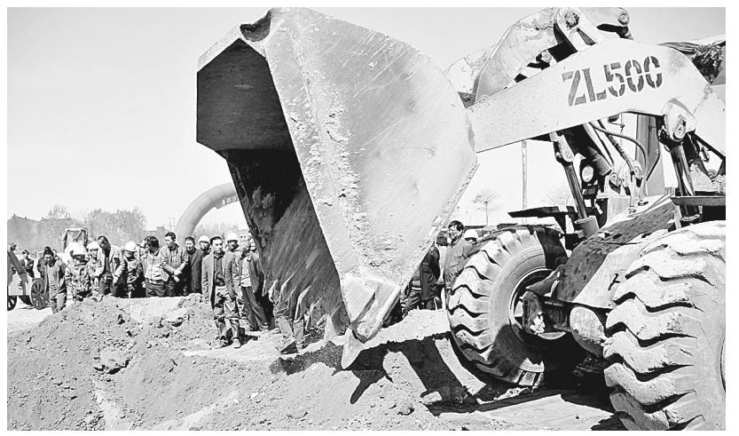
据介绍,新村占地112亩,计划投资8200万元,建设农民新居520户,其中3层连体别墅210户,5层住宅楼31栋310户,并配套幼儿园、社区管理中心、广场、游园、绿地、卫生所等公益设施。工程分两期实施,一期工程年底前可全部完工,明年5月之前,完成各项配套设施,达到入住条件。 图为奠基开工现场。

说:“现在,村民居住比较分散,吃水用电不方便。很快就会搬进别墅了,有水有电,几百户集中住到一块,多热闹呀。”