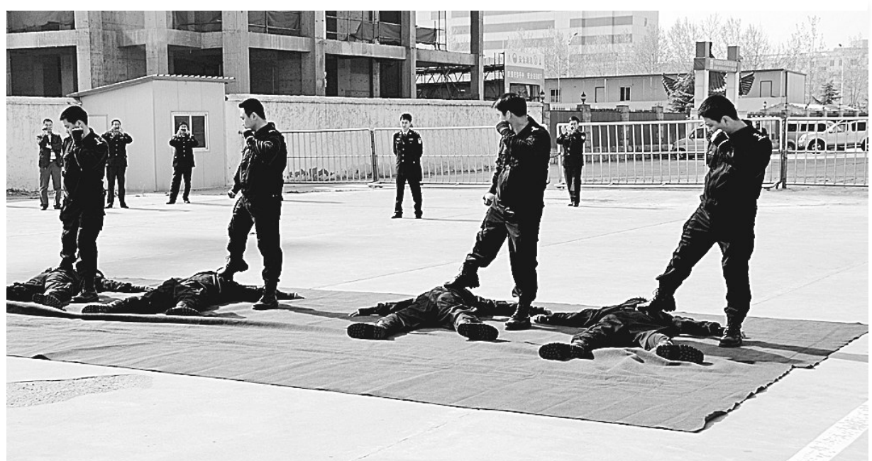
昨日上午,全省法院司法警察岗位大练兵活动现场会在中牟山宾馆召开,来自全省各法院的200多名法官参加现场会。大练兵活动现场,中牟法院司法警察大队和登封司法警察局分别进行了汇报表演。

产业转移、中原经济区和郑州都市区建设、综合保税区和富士康入驻等重大机遇,围绕产业集聚区产业定位,建立专门招商小分队,赴深圳、沿海、郑州等地强力开展招商引资工作。 对落户新港产业集聚区的招商项目,各职能部门要立即办理,并明确到各成员单位,使每一项工作都有人抓、有人管、有人问,确保各项工作有序快速推进。