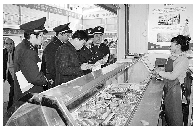
连日来,荥阳市工商局执法人员,深入市场、超市、生鲜肉店等食品销售领域,对流通环节猪肉和肉制品经营者进行全面检查。

本报讯(记者 谢庆 通讯员 李艳艳 高伟峰)为引导和激励企业加强质量管理,提升产品质量,促进经济又好又快发展,荥阳市决定从今年起,在全市开展市长质量奖评选活动。 据了解,市长质量奖是该市设立的最高质量荣誉奖项,主要授予具有独立法人资格,有广泛的社会知名度和影响力,实施卓越绩效管理,在行业内处于领先地位,取得显著经济效益和社会效益的企业或组织,以及提供公共服务的非政府机构。市长质量奖每年评审一次,每次1-5名。