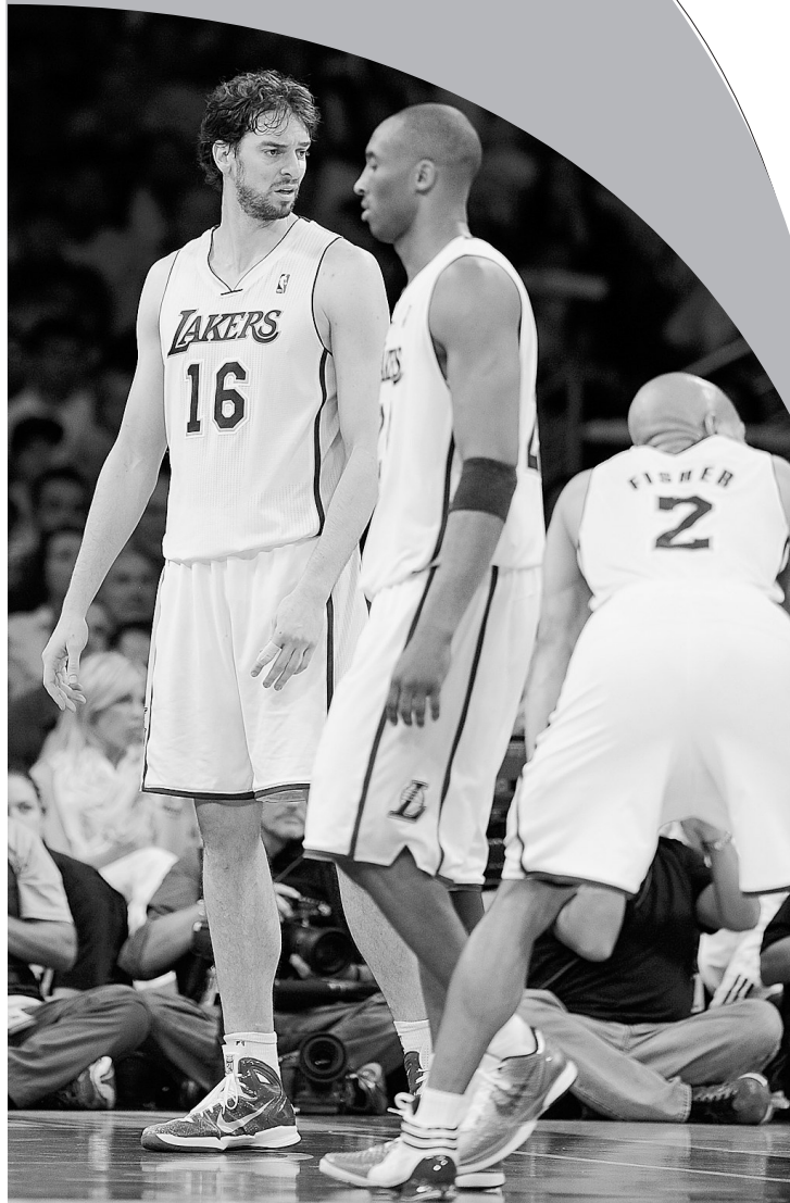
上图:湖人队队员神色黯然。 左图:马刺队球员吉诺比利因伤在场边观战。

雷·阿伦此役得到了全队最高的24分。西区第四名雷霆队与第五名掘金队打得难解难分,雷霆队最终依靠着杜兰特与威斯布鲁克合力砍下的72分以107:103取胜。杜兰特此役得到了个人季后赛最高的41分。