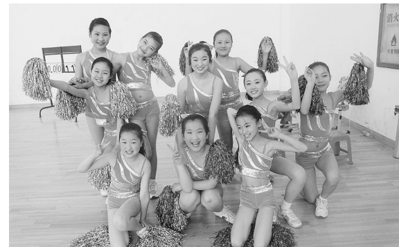
郑东新区康平小学社团活动节日前拉开帷幕。图为同学们热情奔放的啦啦操展示。