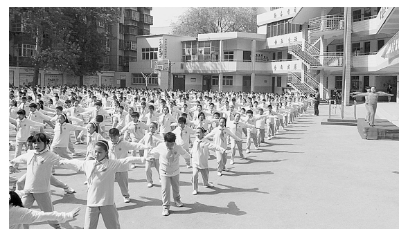
近日,沙口路小学结合本校特色,研究出空手跳绳、跑步操、环形跑等活动,丰富了大课间内容。