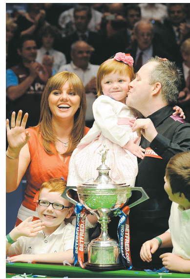
5月2日,希金斯与家人共享胜利的喜悦。当天,苏格兰选手希金斯在2011年斯诺克世锦赛决赛中,以18:15击败英格兰选手特鲁姆普,第四次夺得冠军。

手笔的投资,科学的规划,良好的招商政策让这两大基地成为国内外动漫公司、从业人员关注的焦点。本届动漫节上,这两大基地的招商工作非常成功,与台湾动漫文化创意产业协会、湖南拓维信息系统股份有限公司、湖南金鹰卡通公司等近百家企业洽谈并达成初步合作意向,并与其中20多家国内外知名动漫企业签订了入驻意向。