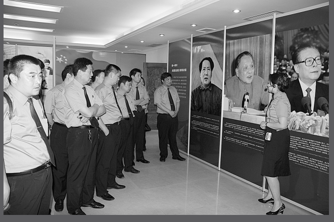
组织干警到井冈山进行革命再教育,推进反腐倡廉工作开展。