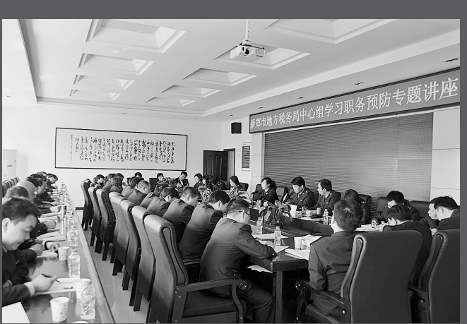
组织“职务犯罪预防”专题讲座。