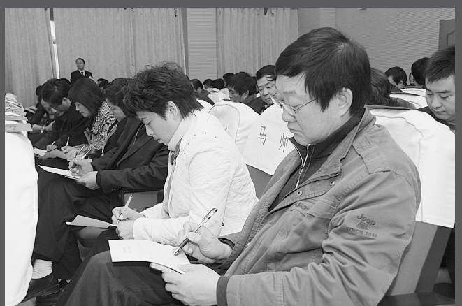
征求人大代表、政协委员、廉政监督员对检察工作的意见和建议。