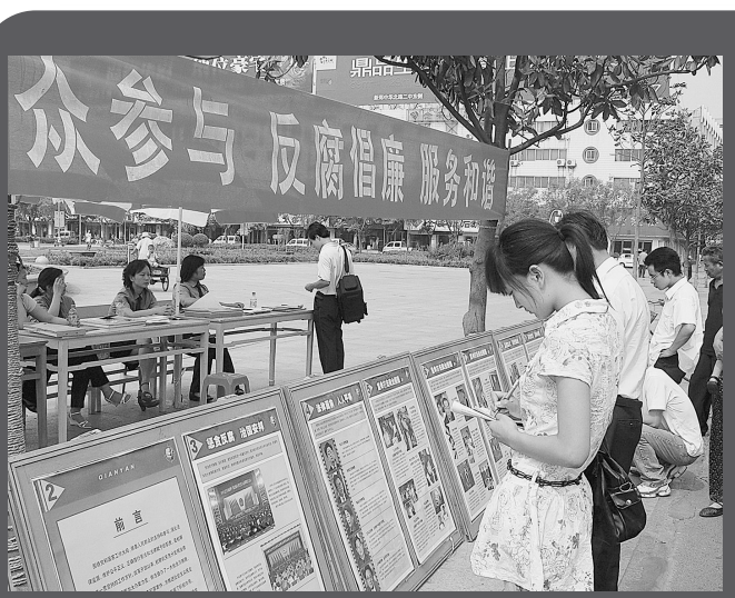
结合“五进”千家行大走访活动,在全市范围内广泛开展法律服务咨询活动。

三项重点工作中,公正廉洁执法是根本。新郑市检察院坚持“一案三卡”、网上监督、纪检监察部门跟踪监督、电子执法档案和讯问全程同步录音录像等制度,深入推进人民监督员制度;学习实践《检察官职业道德基本准则》,集中查找解决存在的突出问题,大力弘扬“忠诚、公正、清廉、文明”的职业操守,加强职业道德建设;开展创建学习型检察院、争当学习型检察官活动,着力提高运用法律政策、执法办案、化解矛盾、群众工作、处置突发事件和应对舆情的能力,切实增强公正廉洁执法能力。