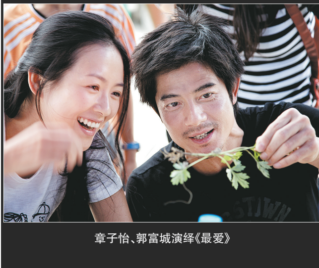
张子怡、郭富城演绎《最爱》