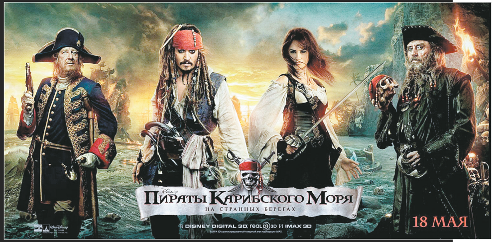
《加勒比海盗4:惊涛怪浪》剧照

本报讯(记者秦华)5月影市大片多。记者昨日从奥斯卡电影院获悉,本月将有《功夫熊猫2》《加勒比海盗4:惊涛怪浪》《雷神》《最爱》等14部影片上映。