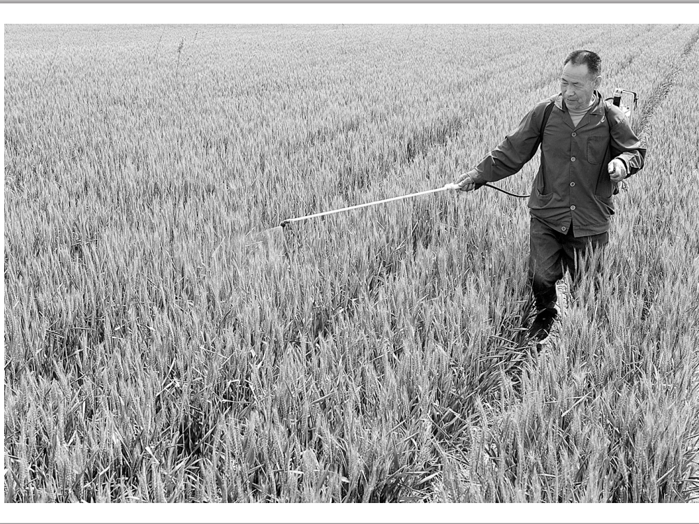
昨日,记者在荥阳豫龙镇看到,农民们正在麦田喷洒农药,灭虫除草。据市农委专家介绍,目前小麦生长进入发育抽穗阶段,极易发生病虫害,提醒广大农民加强小麦中后期管理,力争夏粮丰收。