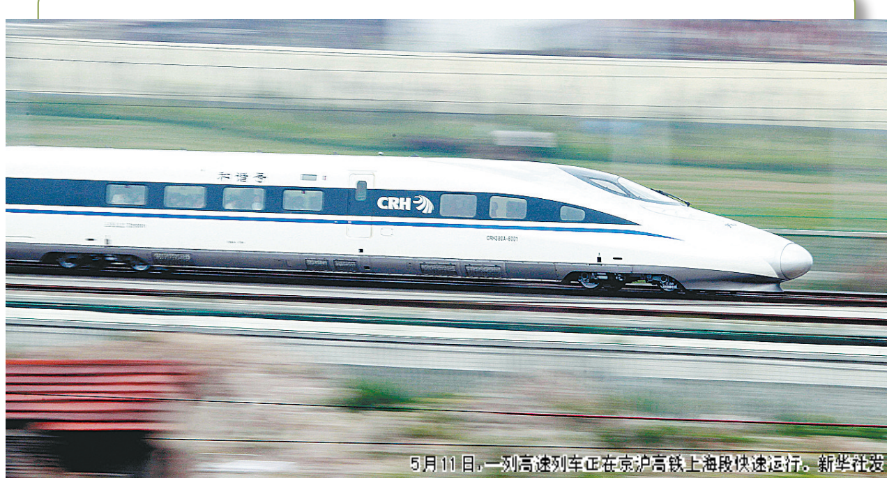
5月11日，一列高速列车正在京沪高铁上海段快速运行。

据新华社电 11日上午8:45，京沪高铁在上海虹桥站开始为期一个月的试运行，据悉，11日共有9趟试跑列车开往北京，车上均不载客，最快一趟列车途中只停一站，4小时48分即可抵达终点站北京南站。