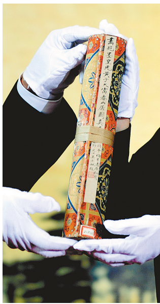
工作人员展示《富春山居图》(剩山图)。

据新华社杭州5月11日专电(记者段菁菁)分藏在海峡两岸的《富春山居图》迈开了“圆合”第一步。11日下午,浙江省博物馆“镇馆之宝”《富春山居图》(剩山图)赴台前的点交启运仪式举行。《剩山图》将由中国文物交流中心先送往北京,再由台湾广文基金会移交台北故宫博物院。