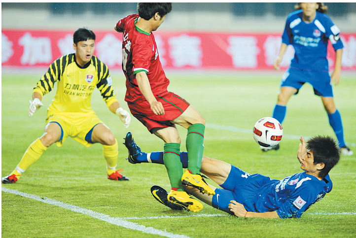
建业与重庆力帆激战正酣。 本报记者 李焱撰

本场比赛,建业主帅金鹤范派出了与联赛几乎一样的最强主力阵容,黄希扬和队长陆峰均出现在首发阵容中,而对手基本上以“青春牌”小将为班底,旨在让队员增加比赛经验。比赛开始后,建业队利用主场之利向对手发起强有力的进攻,第14分钟,建业队前锋获得进攻机会,外援在禁区附近晃过对方防守队员后拔脚怒射,可惜皮球中柱弹出,重庆力帆幸运逃过一劫。之后,建业主帅金鹤范早早做出换人决定,用河滨换下乔巍加强进攻,不过在对手的严密防守下,尽管在场上占据主动,可惜有威胁的射门并不多,上半场双方0:0战成平局。