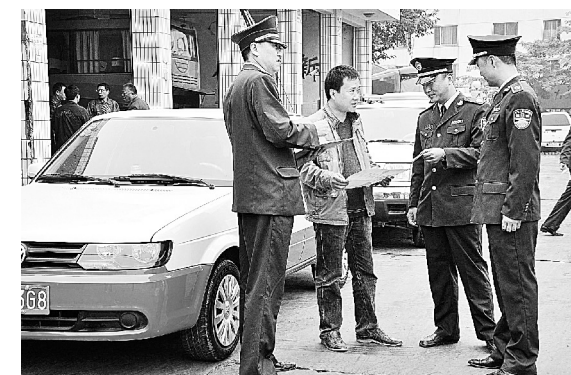
工作人员深入企业,面对服务对象,广泛听取意见和建议。