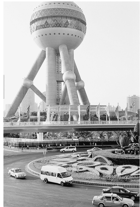
这是上海市陆家嘴金融贸易区一角。

鼓励从事生态环保、节能减排、改善民生、科技进步、保护环境、节能减排企业在区内落户,从税收政策上给予大力支持,鼓励企业自主创新,积极支持企业开展研发,鼓励发展新兴产业,促进区内企业科学、协调、可持续发展。