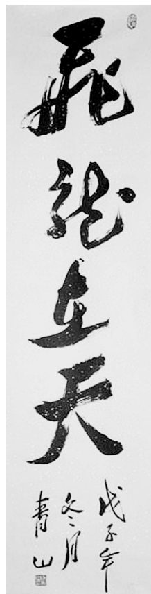
飞龙在天(书法) 马青山