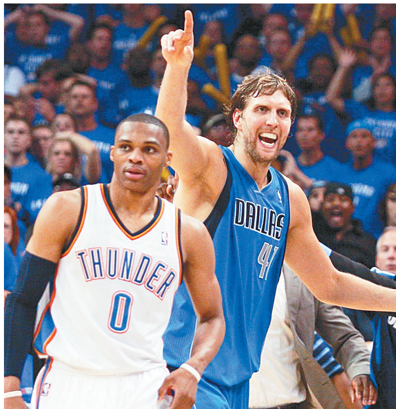
小牛队球员诺维茨基(右)庆祝胜利。

不过,现役NBA得分王、本场收获全队最高29分的杜兰特不自信地表示,球队要保持积极的态度,“一切还没结束呢!”