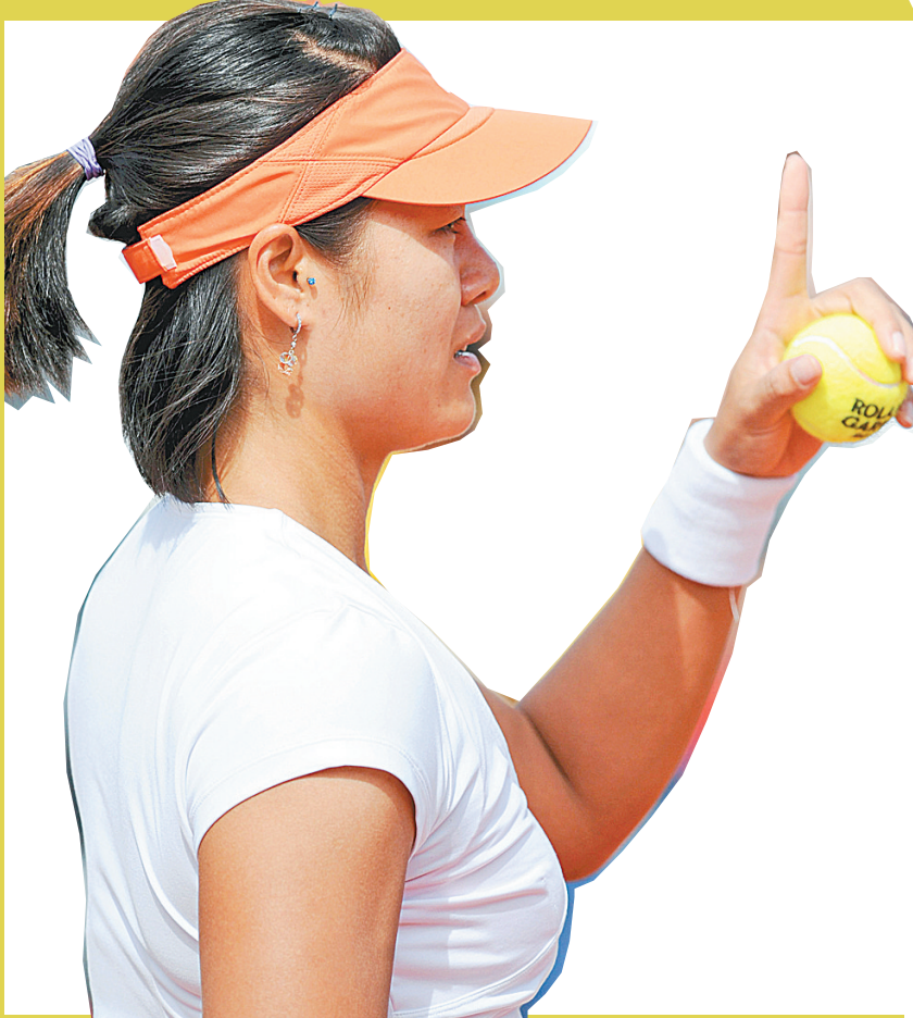
5月24日,中国选手李娜在比赛前的简短练习中,向对手示意再来一球。当日,在2011年法国网球公开赛女子单打首轮比赛中,李娜以2:1战胜捷克选手斯特里科娃,晋级第二轮。另外,中国选手彭帅和郑洁均直落两盘战胜各自对手,闯过第一轮。