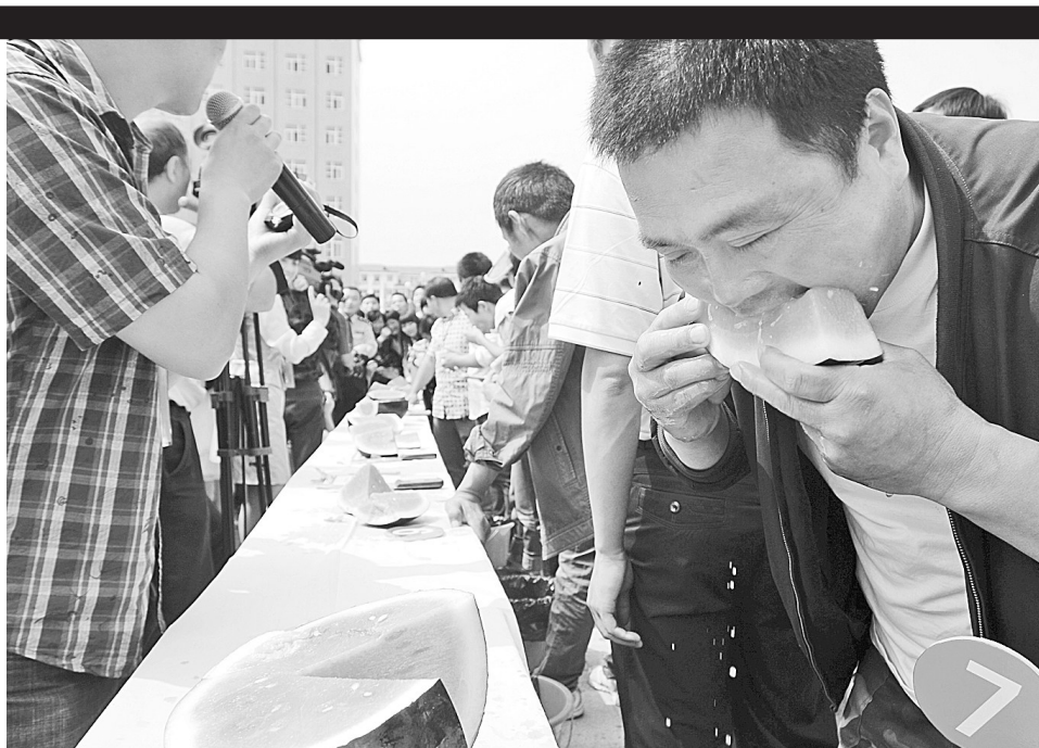
西瓜节吃西瓜比赛。