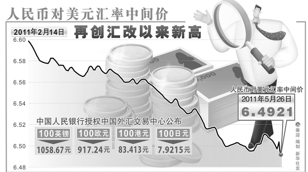
人民币对美元汇率中间价 再创汇改以来新高

据新华社上海5月26日电(记者 潘清)延续前一交易日的调整势头,沪深股市26日高开低走、双双收跌,再度创下4个月收盘新低。上证综指跌0.19%,深证成指跌0.73%。两市成交虽略有放大,但仍处于低位徘徊状态。