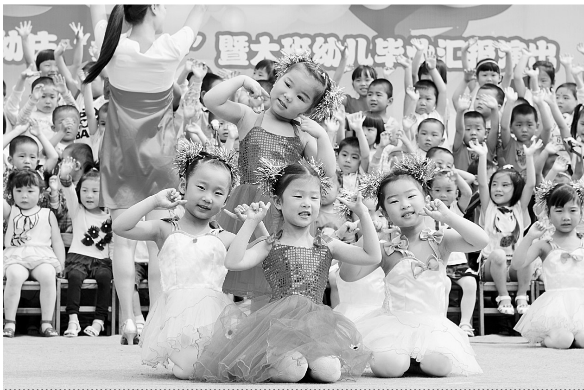
5月30日上午,登封市直一幼举办“六一”暨大班幼儿毕业汇报演出。小朋友们表演了舞蹈、环保时装秀、故事、大合唱等12个欢快节目。

一直以来,登封市积极营造良好环境,多头引线搭桥,大力加强引导,推动大学生村干部干事创业,成长成才。该市通过举办“大学生创业信贷融资对接会”,邀请金融、财政、劳动、文化等单位与大学生村干部面对面答疑解惑、排忧解难。东华镇大学生村干部王宁贷到了2万元小额贷款,市文化局也送来图书1000余本,办起了“耕读公益图书室”;石道乡冠子岭村大学生村干部高志阳贷款5万元,创办了嘉禾“獭兔养殖基地”,逐步发展生态循环养殖,带动乡邻致富。如今,高志阳精心饲养的首批1000多只獭兔,一半已经出栏,市场前景十分可观。登封市委组织部出台了《大学生村干部“百分制”考核办法》,细化考核项目,量化考核分值,对每一名大学生村干部的德、能、勤、绩、廉、学进行全面考核,并将考核结果逐人反馈,使他们看到成绩,看到差距,看到希望,加快成长。通过此种方式,大学生村干部得到了全方位锻炼,自身素质有了显著提高。在去年的省委选调生考试中,该市有3名大学生村干部进入到政审环节。