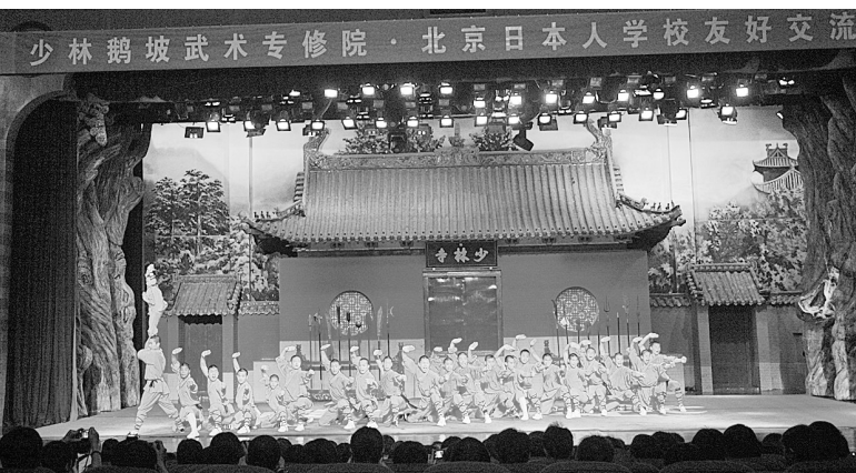
1日,在中国日本大使馆附属北京日本人学校就读的149名日本青少年来到登封少林鹅坡武术专修院参观、学习、交流。这是该校自2006年以来第三次到少林鹅坡武院参观交流访问。

准叶离开的可能性最高。昨天,前一段网上介绍的澳大利亚中场尼卡斯已经抵达郑州,与全队参加了抵郑后的第一堂训练课,能否最后留用还要看教练组的考核。尼卡斯是一位中场球员,曾经效力于澳超联赛的中央海岸、昆士兰怒吼队,并在去年入选了澳超青年联赛最佳阵容。据了解,除尼卡斯外,还有几名外援可能过来试训,引进的标准还是锁定在中前场,以求尽快解决目前建业锋线乏力的尴尬局面。