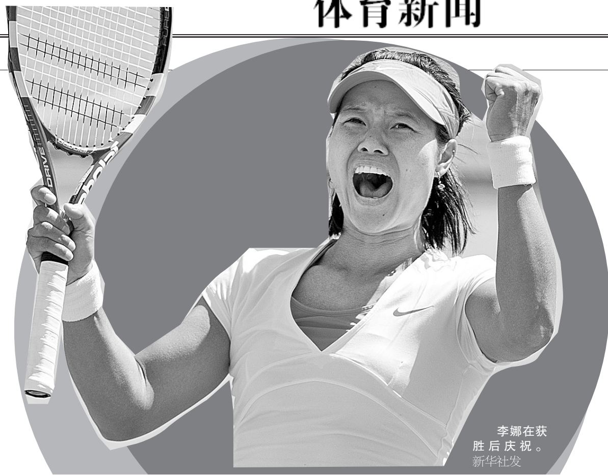
李娜在获胜后庆祝。