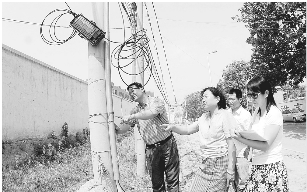
昨日,市畅通办组织20个小组,分别对市区线杆占道情况进行调研。通过调研区分责任单位,制定整改方案,还路于民。图为第一小组在中原区调研。

7月1日起,“三支一扶”大学生工作生活补贴标准调整为:大专生由不低于800元/月提高到1500元/月,本科生由不低于900元/月提高到1600元/月,研究生由不低于1000元/月提高到1700元/月。在此基础上,各地可根据当地经济发展和物价水平变化以及同岗位人员待遇水平等情况,适当提高补贴标准。