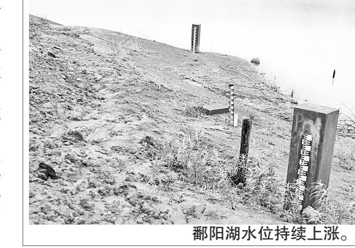
鄱阳湖水位持续上涨。