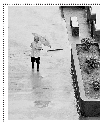
6月8日,在闽江干流富屯溪畔,一名男子在福建省顺昌县城江滨大道上行走。