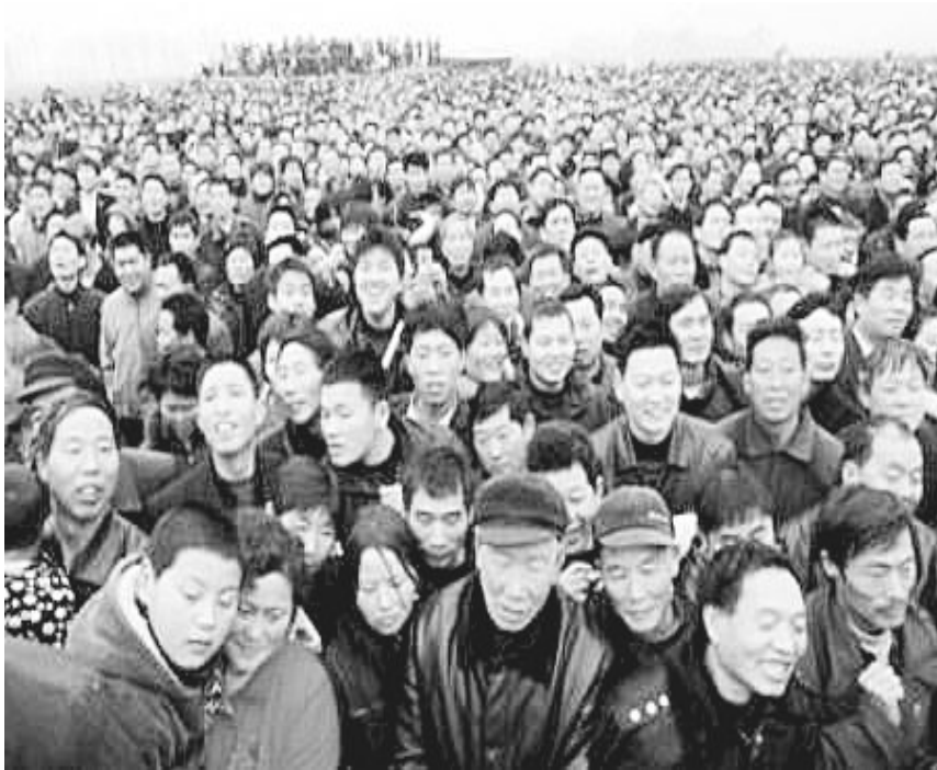
少子化、老龄化并存,教育等公共资源待重新配置 (资料图片)