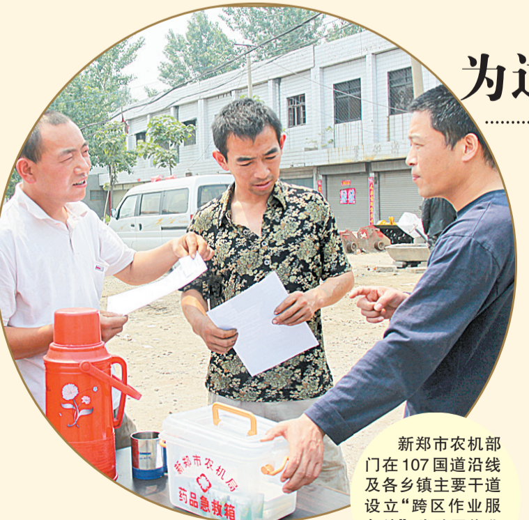
新郑市农机部门在107国道沿线及各乡镇主要干道设立“跨区作业服务站”，为跨区作业农机手提供服务。

据了解，按照“田成方、路相连、林成网、井通电、管相接、旱能浇、涝能排、亩增产”标准，从2010年开始，新郑市已在龙王乡铁李村、城关乡官刘庄村等地建设了3块邮政万亩示范田，面积达两万多亩，开辟了整合支农资源、推动集约管理、搭建为民服务平台、农民投入不增加即可实现增产增收新模式。