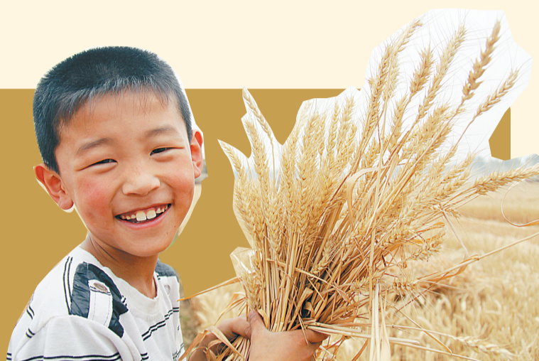
趁着端午节学校放假，上三年级的小涛也来到田间帮父母抢收小麦，体验“农忙”。

咬发霉变质等损失按5%计算，每年要损失50吨，而由面粉厂以科学管理方法统一代存，则相当于为农户增加了100亩小麦的产量。 这种便民的粮食收购以及新型的存粮换粮的方式，不仅能给老百姓带来真正的实惠和方便，提高农民种粮的积极性，而且让老百姓也参与到市场经济中去，尊重了百姓对粮价的要求，同时更能保障企业的原料供应、商品销路，真是一举多得啊!