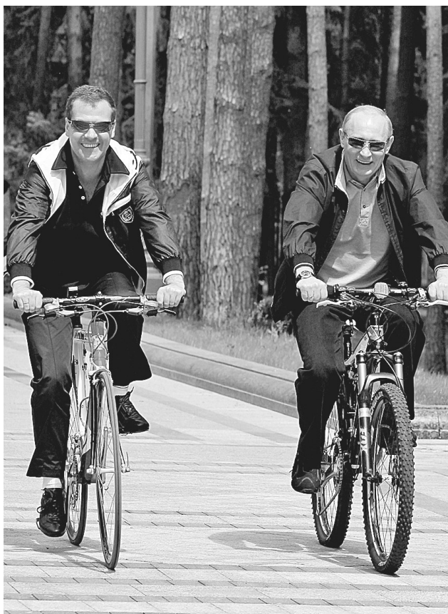
6月11日，俄罗斯总统梅德韦杰夫(左)和总理普京在莫斯科郊外的总统府进行非正式会谈期间骑车。