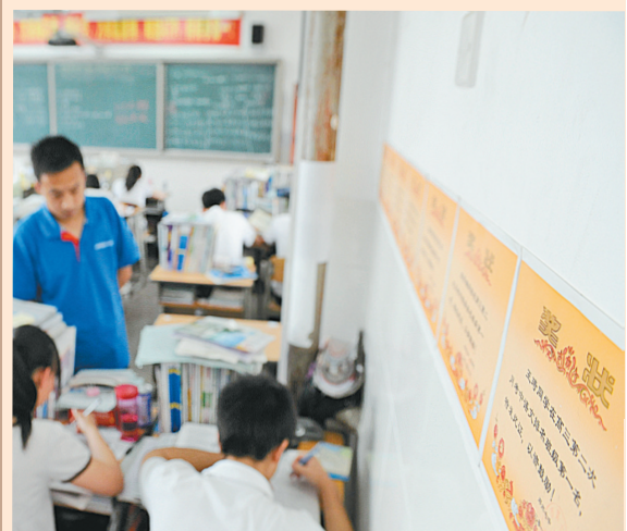
▲一张张奖状的背后都凝聚着闫老师的心血。