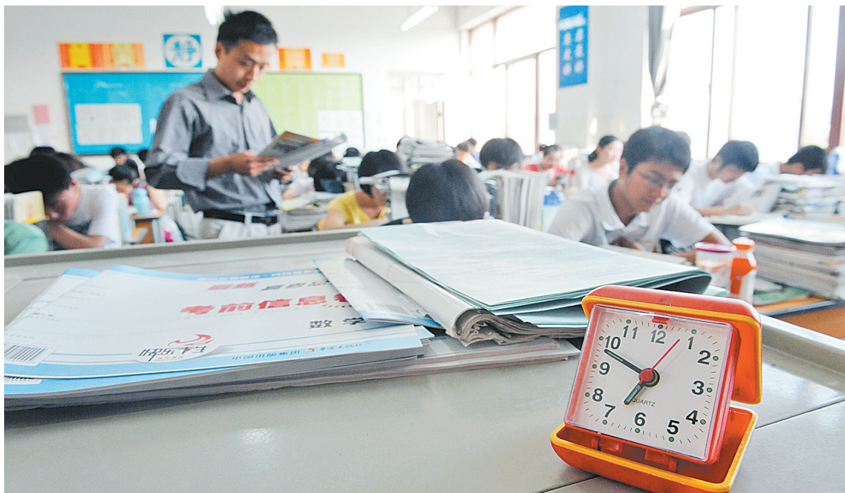
▲清晨6点50分之前,闫老师都会准时出现在教室和同学们一起早读。