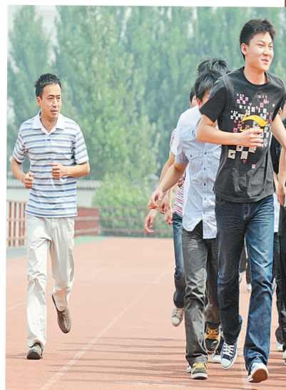
▲课间,闫老师和学生们一起锻炼身体。