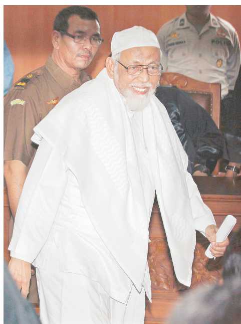
6月16日，在印度尼西亚首都雅加达，印尼“伊斯兰团”精神领袖阿布·巴卡尔·巴希尔在法庭对他宣判后离开。

据新华社雅加达6月16日电 印度尼西亚首都雅加达南区法院16日宣判，72岁的印尼“伊斯兰团”精神领袖巴希尔鼓动他人向恐怖主义活动提供资金罪名成立，判处他15年监禁。 法官斯旺托罗说，在巴希尔的鼓动下，多名恐怖嫌疑人通过各种筹资手段，为恐怖分子在印尼亚齐特别行政区的山区里组织军事训练营提供了大量资金。 巴希尔对判决结果表示不服，称准备提出上诉。负责巴希尔案的检察官班那在休庭后说，检方也对此判决结果不满，计划在7天内提出上诉。 此前，检方在法庭上要求判处巴希尔终身监禁。 去年8月，印尼警方因巴希尔涉嫌与藏身在亚齐特别行政区偏远丛林里的恐怖分子有牵连在西爪哇省将其逮捕。此前，巴希尔曾因涉嫌参与2002年巴厘岛爆炸案等恐怖袭击事件而被监禁两年多，并于2006年6月获释。 巴希尔原是印尼中爪哇一所教会学校的创始人。上世纪70年代末，他因颠覆罪名被捕入狱，后流亡马来西亚，1998年回到印尼，于2000年组建了“印尼穆斯林理事会”，并一直担任该组织主席。据报道，“伊斯兰团”与“基地”组织有密切联系，涉嫌参与了东南亚地区一系列恐怖活动。