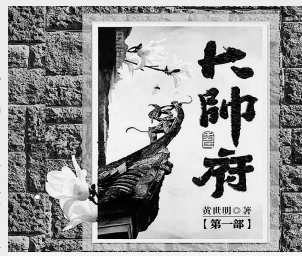
一个大帅府 两代东北王 墙外铁马金戈 墙内胭脂红翠 张学良：没想到日本真下手了