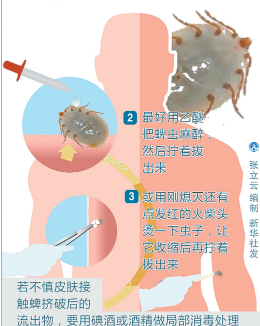
张立云 编 新华社发