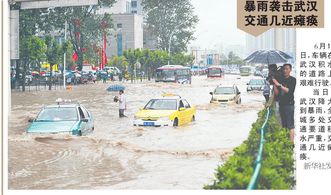
暴雨袭击武汉 交通几近瘫痪

气象专家建议相关地区和部门切实做好防御暴雨应急工作,注意城市、农田排涝;安徽南部和大别山区、河南南部等地发生地质灾害的可能性大,要防范可能引发的山洪、滑坡、泥石流等灾害。