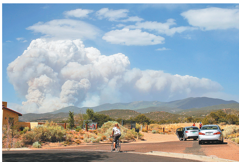
6月19日,在美国新墨西哥州圣菲市,山火产生的浓烟飘向空中。据当地媒体报道,发生在美国新墨西哥圣菲国家森林公园的山火已烧毁200英亩土地,目前火势仍在继续。