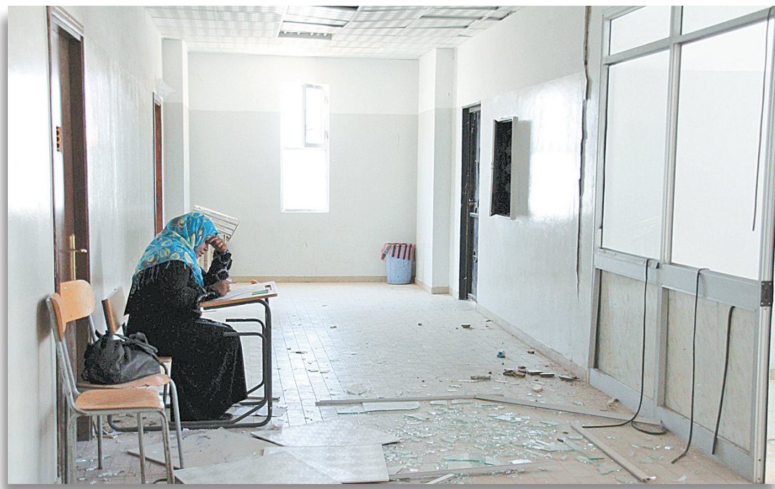
6月18日,在利比亚首都的黎波里的纳赛尔大学,一名女子坐在遭到北约轰炸的教学楼里。

此外,据报道,当天利比亚政府军和反政府武装在利比亚西部的米苏拉塔发生激烈战斗,造成9人死亡,15人受伤。